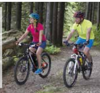
Kein Sanitätsdienst und keine Bewirtung auf dieser Strecke. Befahren auf eigene Gefahr.

Auch in diesem Jahr! Alternativstrecke für Mountainbiker durch die Söhre: GPX-Track unter www.fuldaradeln.de